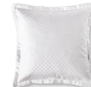
9039 LIVORNO 0000 weiß