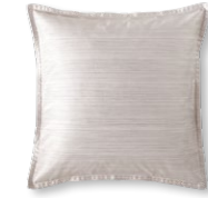
9033 BENTE 0255 natural