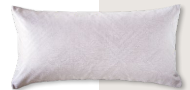
9045 LUND 0263 kaschmir