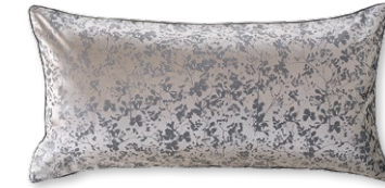
9046 NORA 1147 graugold