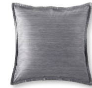
9033 BENTE 0253 stone