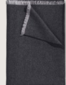
1600 PLAID 9172 anthrazit