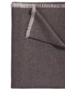
1600 PLAID 9193 mahagoni