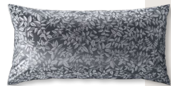
9047 SKAGEN 1146 schattengrau