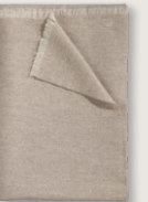
1600 PLAID 9145 smoke