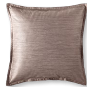
9033 BENTE 0256 chocolate