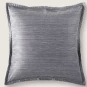
9033 BENTE 0253 stone